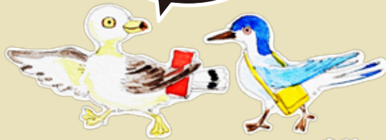
ウミネコが旅のアジサシをもてなしているところ